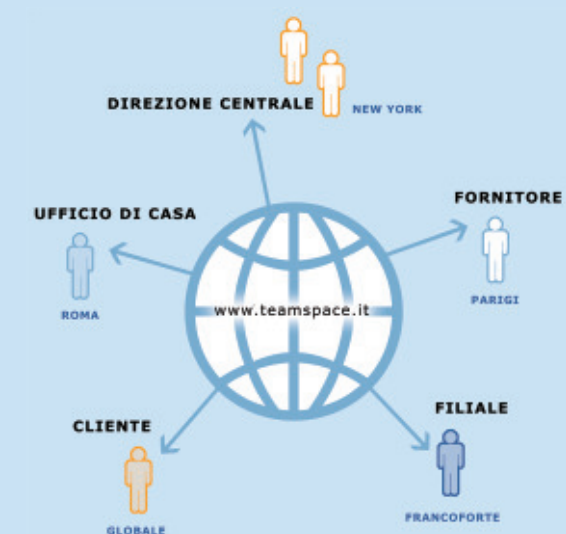
Il concept di teamspace